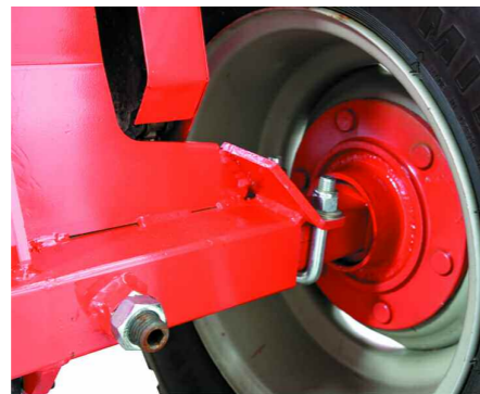
Eje rueda regulable Adjustable wheel axle