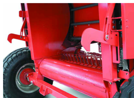
Ganchos cierre apertura puerta Hooks opening/closing rear door

Recolector (Pick-up) de 1,70 m y 2 m de ancho equipado de dos sinfines para una recogida veloz y elevada sobre cualquier tipo de hilera de pasto.