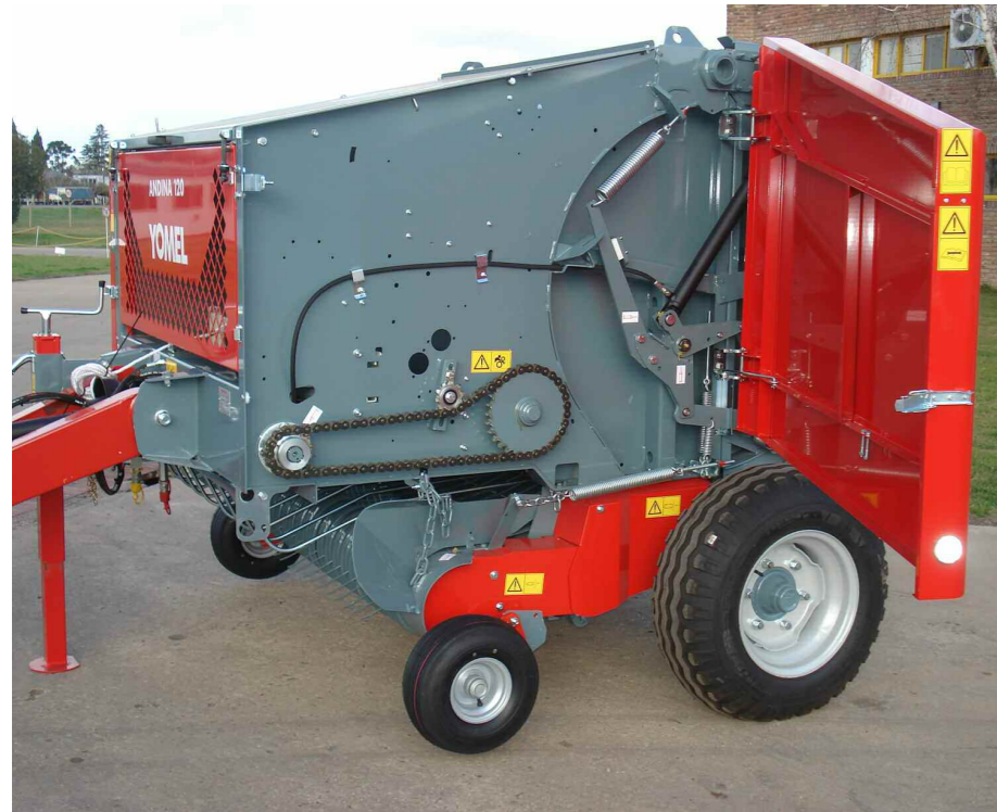
Visual carter lateral View side carter