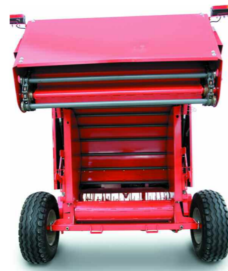
Camara con puerta abierta Chamber with open rear door

Enganche regulable con posibilidad de variación de la altura de la máquina para la adaptación a los diferentes tipos de tractor.