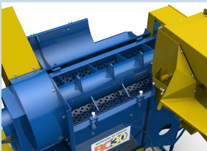
ROTOR TRILLADOR / THRESHER ROTOR

BC-30 MOTOR , pequeña, leve y eficiente, una trilladora justo para los pequeños agricultores. También disponible en la versión para accionamiento por motor eléctrico, diesel o gasolina. Small, light and efficient, a thresher just right for small farmers. Also available in the version for electric motor drive, diesel or gasoline engine.