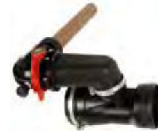
Aplicador de Granulados | Granule Applicator* U8076.00

*Accesorio desarrollado para aplicación de productos en polvo y granulados. Para utilización del accesorio en lo Aplicador de Granulados/Atomizador UVV-BV 11L, consulte el manual del equipo. | *Accessory developed for application of powder and granular products. For use this accessory at the 11L Granule Applicator ULV-LV Nebuliser, see the equipment manual.