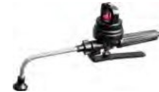
Dosificador Universal de Líquidos con Tubo Aplicador | Dosimeter Valve with Applicator Pipe U8018.00