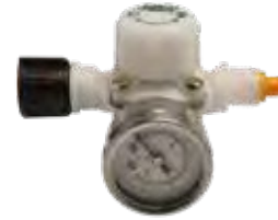
Regulador de Caudal con Manómetro | Flow Rate Regulators with Pressure Gauge U9634.00