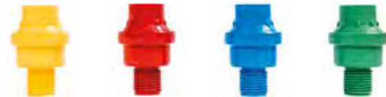
Válvula Reguladora de Presión y Caudal Regulating Valve Pressure and Flow Rate Amarilla | Yellow (1BAR) - U7464.00 Rojo | Red (1,5 BAR) - U7465.00 Azul | Blue (2 BAR) - U7466.00 Verde | Green (3 BAR) - U7467.00