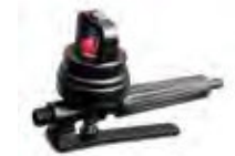
Dosificador Universal de Líquidos sin Tubo Aplicador | Dosimeter Valve without Applicator Pipe U8096.00