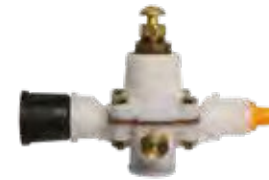
Regulador de Caudal Standar Sin Manómetro | Flow Rate Regulator Standard without Pressure Gauge U9639.00