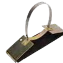
Apoyo Dorsal | Back support* 9589.00

Accesorio para aplicación de defensivos para el combate de polillas. Este kit puede ser adaptado a cualquier válvula de descarga con sistema de rosca universal. | Accessory for the application of products to fight termites. This kit can be adapted to any discharge valve with a universal screw system.