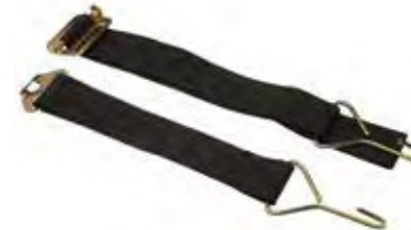
Correa abdominal para mejorar la fijación de equipos dorsales. | Belt to improve the fastening of backpack equipment. 9774.00