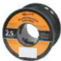
CABLE DOBLE AISLADO DURO G62702 Para cables de salida y uso subterráneo.