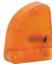
DESVIADOR DE RAYOS G64800 Gallagher recomienda que todos los energizadores en instalaciones permanentes estén equipados con un desviador de rayos para ayudar a protegerlos de daños provocados por éstos.