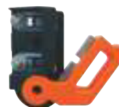
INTERRUPTOR CUCHILLO NARANJO G60770 Permite apagar una sección del cerco para realizar un diagnóstico de funcionamiento y mantenimiento.