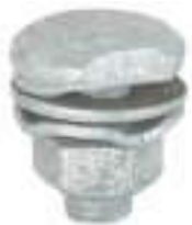
ABRAZADERA HEXAGONAL G60355 Conecta hasta seis cables al cerco de forma segura.

Gallagher recomienda los siguientes productos para montajes de conexión a tierra y salida, por favor consultar la página 6 para otras opciones.