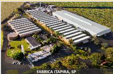
FABRICA ITAPIRA, SP

Las más productivas y confiables del mercado!