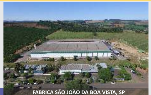
FABRICA SÃO JOÃO DA BOA VISTA, SP

Línea de Maquinaria Estacionaria JF, la solución para el ganadero!