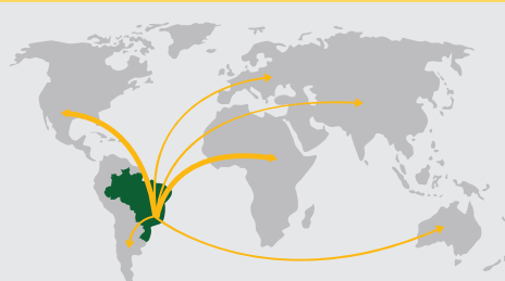
DESDE BRASIL PARA MÁS DE 50 PAÍSES EN TODOS LOS CONTINENTES