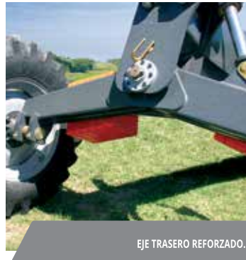
EJE TRASERO REFORZADO.