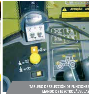
TABLERO DE SELECCIÓN DE FUNCIONES. MANDO DE ELECTROVÁLVULAS.