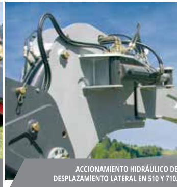
ACCIONAMIENTO HIDRÁULICO DE DESPLAZAMIENTO LATERAL EN 510 Y 710.