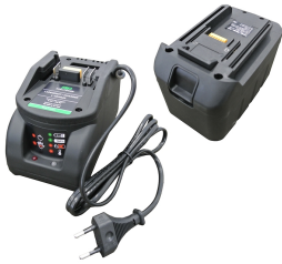
Batería de manganeso de 12 V con cargador de batería (enchufe europeo tipo C) y ranura para batería