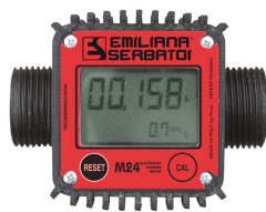
Contador de litros digital mod. M24, para gasóleo

Para gasóleo y gasolina. Filtración de impurezas. Capacidad de filtración 60µm. Caudal 50 l/min.