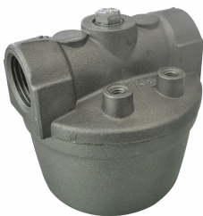
Filtro de red de acero INOX

Para gasóleo y gasolina. Filtración de impurezas. Capacidad de filtración 60µm. Caudal 50 l/min.