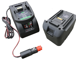
Batería de manganeso de 12 V con cargador de batería (toma de mechero) y alojamiento de batería