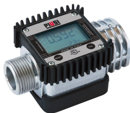
Contador de litros digital para gasolina K24 ATEX