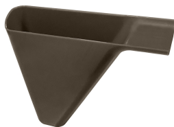
Bandeja colectora de goteo