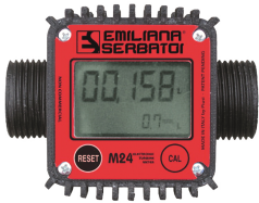
Contador de litros digital mod. M24, para gasóleo